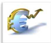
Image des banques : les mutualistes sortent du lot (Les Echos)

Le prêt immobilier : un produit appelé à évoluer (Sia Partners)